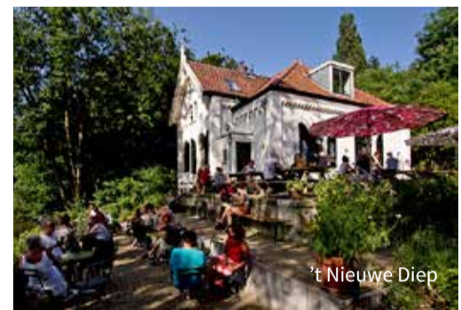
't Nieuwe Diep

In het voormalig gemaal van de Oetwalerpolder kun je ter plekke gestookte jenever, likeuren en bitters proeven.